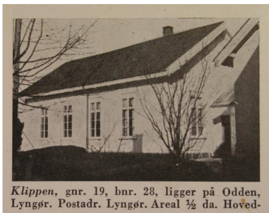
Klippen, gnr. 19, bnr. 28, ligger på Odden, Lyngør. Postadr. Lyngør. Areal ½ da. Hoved-

Vi kan lese i begynnelsen av protokollen fra 1900