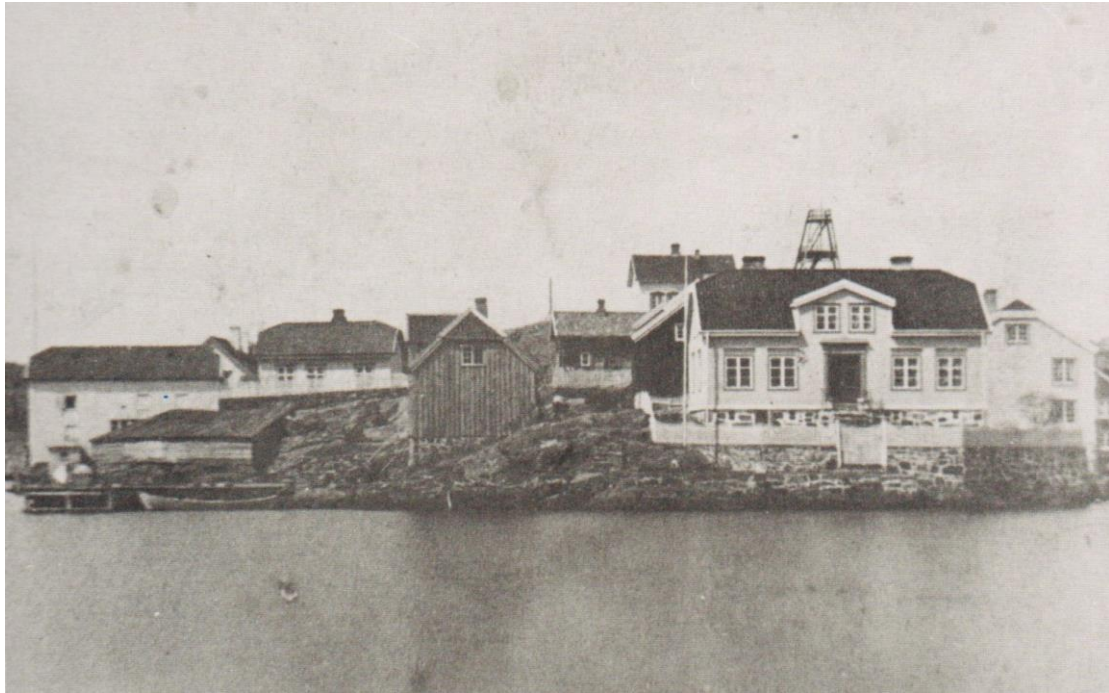
Anders Olsens lager, Emils 1. hus, skomakerens hus, lavt tårn, Pynten. Holmen fra syd ca. 1865

Det kan også være en varde med en stang på toppen, gjerne med to trerammer i kryss øverst på stangen, så den skal bli lettere å se. Alle som har vært til fjells har sett sånne. Ved en befaring til det høyeste punktet på Holmen, syd for skolen, finner vi en liten metallbolt, som har en prikk i midten. Et par meter fra den er det noen boltehull, dels med bolter i, som danner en firkant på ca 4,5 m. Det er tydelig at 4 ben har vært festet i fjellet. Tårnene har stått der ! Hjørneboltene/-hullene må ha vært brukt til begge tårn. Sett i forhold til huset ved siden av kan det første tårnet ha vært ca 11 m høyt, det andre én «etasje» høyere, ca 13 m, med en 7 m høy mast på toppen. Det var smått stell med flaggstenger på den tiden, så det er lite sannsynlig at dette var en flaggstang. Den kan likevel ha vært forsynt med et slags flagg eller merke, som kunne ses på lang avstand, helt fra Sildeskjær til Askerøya, og alle steder innenfor. Det er nærliggende å tro at masten kan ha vært brukt som det ene siktepunktet i sjømålingene, der de målte alle de dybdene som vi ser på sjøkartet. Norges geografiske oppmåling, forkortet NGO, ble grunnlagt 1773 med rent militært formål. Fra 1785 begynte sjømålingene, i 1932 utskilt som Norges sjøkartverk. Institusjonene ble igjen slått sammen til Statens kartverk i 1986. De mener at Sjøkartverket ikke har bygget tårnet, men kan meget vel ha benyttet det til kartlegging av sjøområdet med havdybder og skjær.