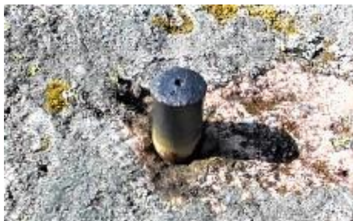
Bolten i midten av tårnet.