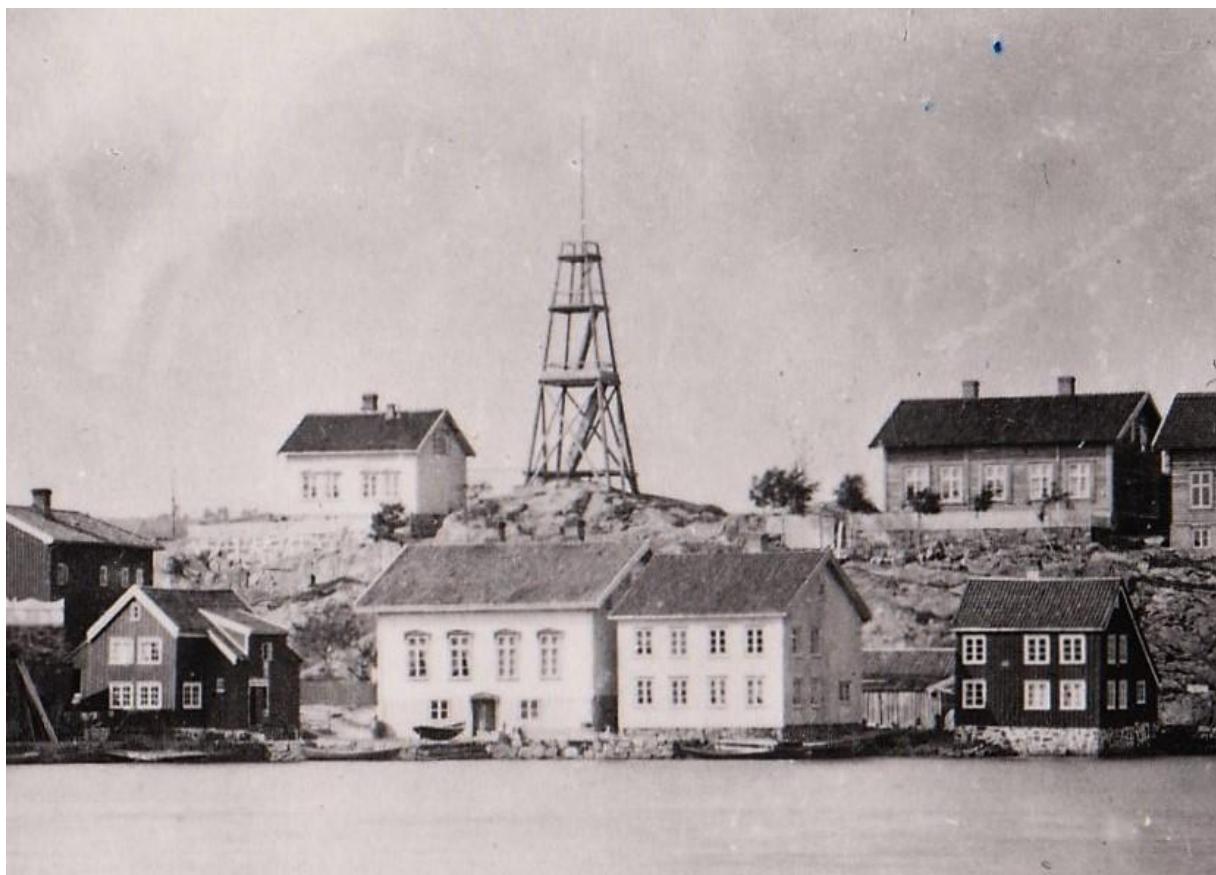
Tårnet i 1875, sett fra Bommen