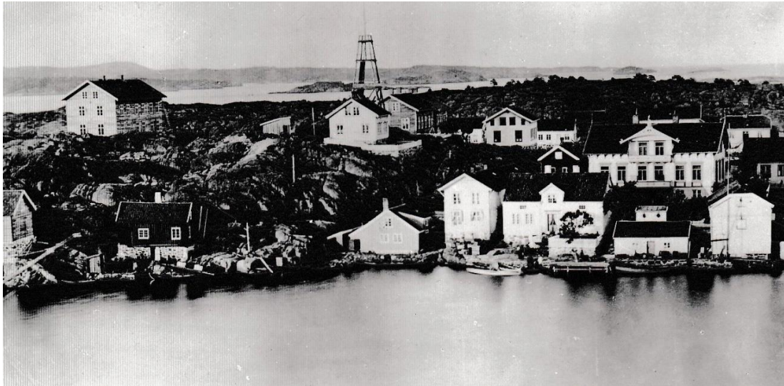
Holmen i 1875.