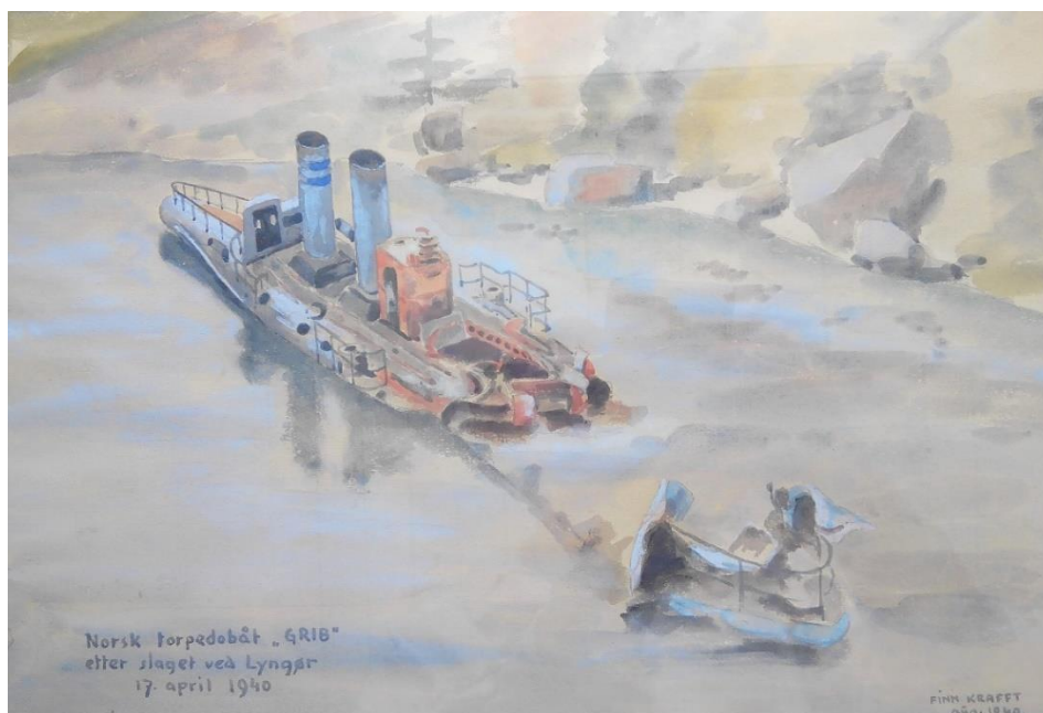
Finn Kraffts akvarell 1940

Krigen merket vi ikke så mye av i Lyngør, men det startet med at 3 torpedobåter ble senket av mannskapene, henholdsvis bombet og beskytt av tyskerne. En av dem, «Grib» senket 17.april 1940, lå i en liten sandbukst innenfor Askerøya. Den hadde en torpedo i røret foran. Vi gikk inn i rommet der og kunne dreie på propellene !