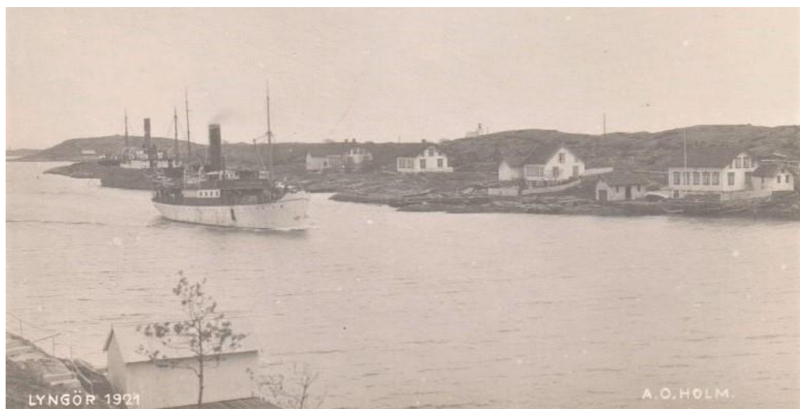
Rutebåten i Sundet og Villa Soles badehus 1921.