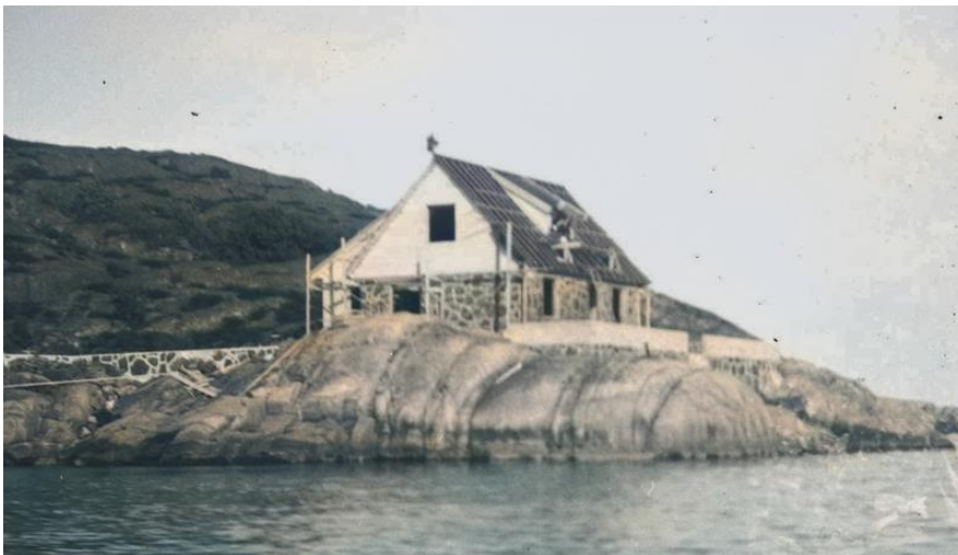
Ringpynten blir bygget, 1946