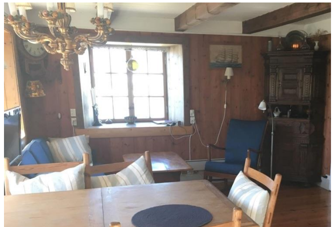
og i 2018 (..man er blitt enige om hvor skapet skal stå..)