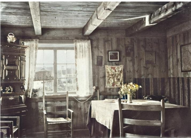
Stua ca 1926

Opprinnelig var det bare ett vindu i muren på vest-veggen, men der ble det satt inn enda et vindu i 1976 for å få mer lys inn i stua. På slutten av 80-tallet slo de hull i veggen til cisternen og gjorde det om til bad, da hadde de fått innlagt vann fra fastlandet.