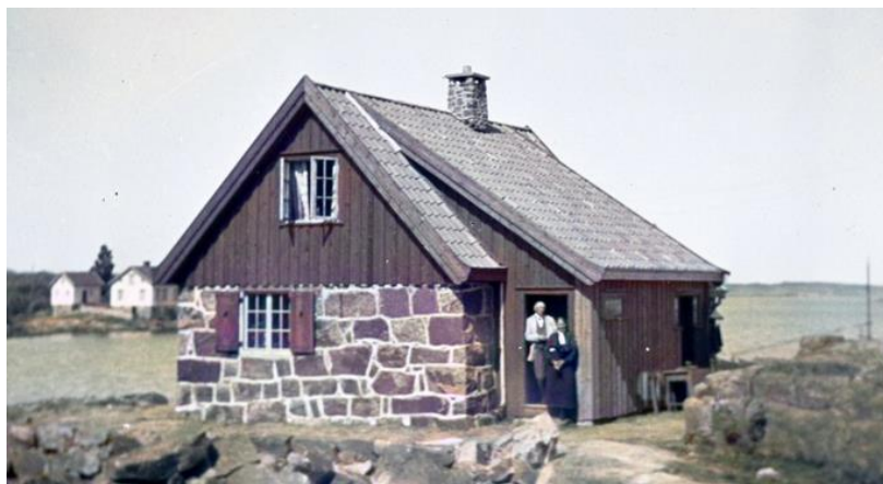
Steinbo som ny i 1925