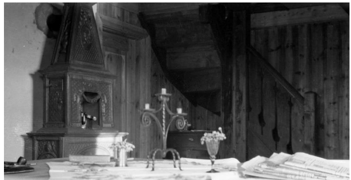
Ovnen er fra 1793 (Hassel Værk) – kjøpt på auksjon på Askerøya i ca 1925