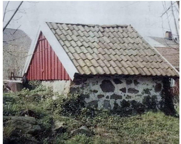
Eksempel på potetkjeller på Lyngør (står bak Tollboden)

Hytta er ikke stor, men det ble likevel bygget egen kjøkkeninngang og et «pikeværelse» innenfor kjøkkenet der hushjelpene bodde. På kjøkkenet sto det en vedkomfyr som var i bruk fram til 1976.