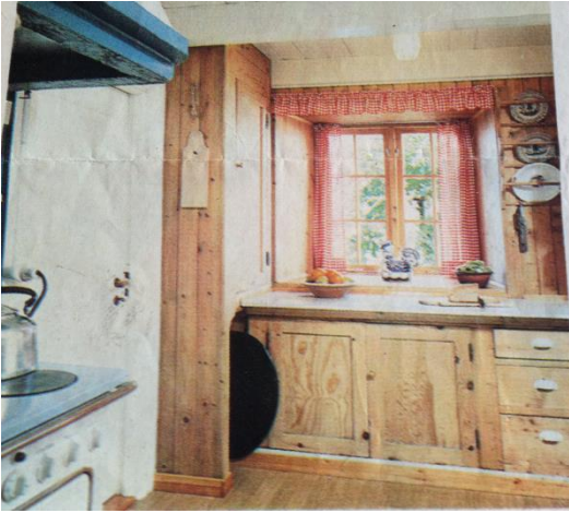
Den originale kjøkkeninnredningen og døren til pikeværelse