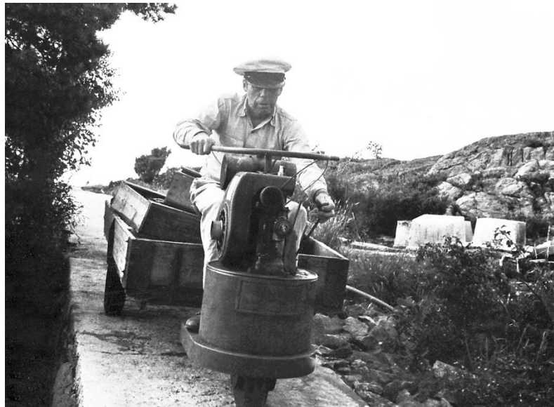
Da minkfor-kjøkkenet var hjemme, kjørte Anders ei motortralle med de daglige rasjonene over til minkfarmen ved Førstekjær.

I mai måned ble minkungene født, da kunne det komme opp til 12 -13 i kullet. Ungene var da knapt lengre enn en fyrstikk. I november var minken ca. seks måneder gamle. Da ble de avlivet, og pelsingen varte ut til midten av desember måned. Skinnene ble rengjort for alt fett og ble lagt inn i en roterende trommel sammen med sagmugg. Deretter ble skinnene tørket og de fikk en ny omgang i trommelen.