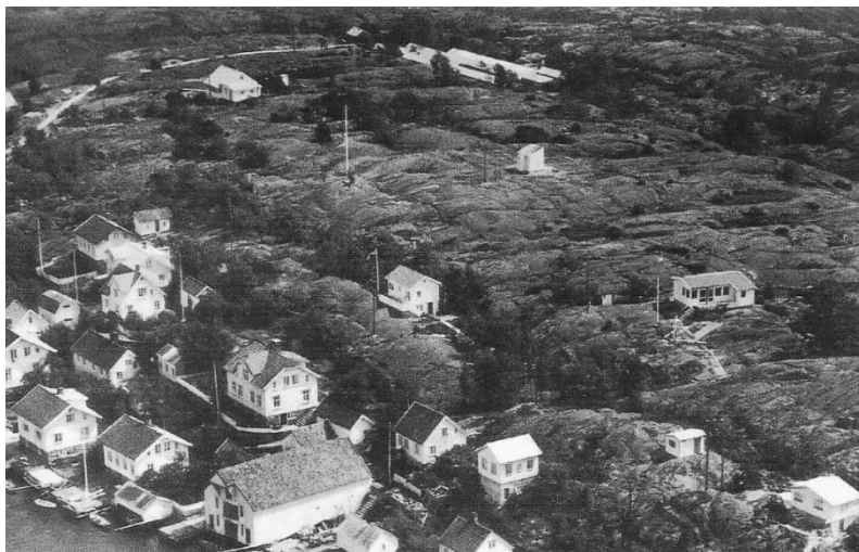
Flyfoto over Lyngør der minkfarmen sees øverst.

I et intervju med Arbeiderbladet i 1961 fortalte han at han hadde gravd etter gull og studert inkaenes hemmeligheter. Han fortalte også at i stua i sin heim hadde han bilder av inkaindianere som han hadde vært nære venner med. Han hadde også gode venner blant jevnaldrene peruanere i byen, og hadde til og med vært faddere til to barn.